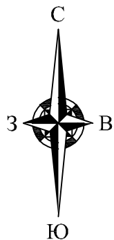
Схема расположения земельного участка или части земельного участка на кадастровом плане территории

Кадастровый номер земельного участка 43:00:000000:68 Местоположение земельного участка: Кировская обл., Кирово-Чепецкий район Категория земель: Земли промышленности, энергетики, транспорта, связи, радиовещания, телевидения, информатики, земли для обеспечения космической деятельности, земли обороны, безопасности и земли иного специального назначения Цель предоставления для строительства линейного объекта: "Распределительный газопровод в д. Каркино Кирово-Чепецкого района Кировской области" Общая площадь земельного участка: 7519018 кв.м Общая площадь частей земельного участка -1506 кв.м Площадь части земельного участка 43:00:000000:68/чзу1 - 511 кв.м